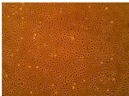
CSACBRI181 ヒト網膜毛細血管内皮細胞(RE)