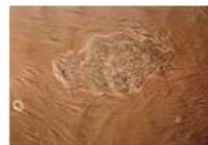
サル ES 細胞の例