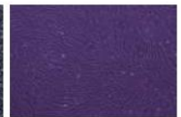
ヒト脂肪由来幹細胞の例