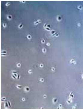
培養 1 日目

Asian derived Normal Human Epidermal Keratinocyte Cell